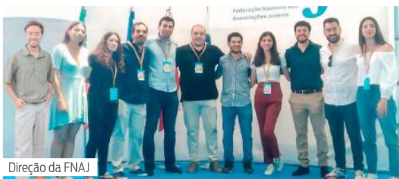
Direção da FNAJ

O encerramento do 18.º ENAJ foi palco da tomada de posse dos novos Corpos Sociais para o biénio 2022/2024 da FNAJ.