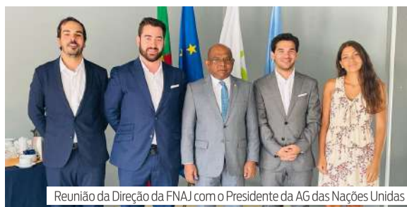
Reunião da Direção da FNAJ com o Presidente da AG das Nações Unidas

The ongoing work to establish the new UN Youth Office is a reflection of our dedication to youth engagement in multilateral diplomacy. I hope the youth see that their elders are listening and that their inclusion is a priority to us. As we move forward, we must work together to place young people at the heart of multilateralism, ensuring that their perspectives are reflected in the UN's work around the world.